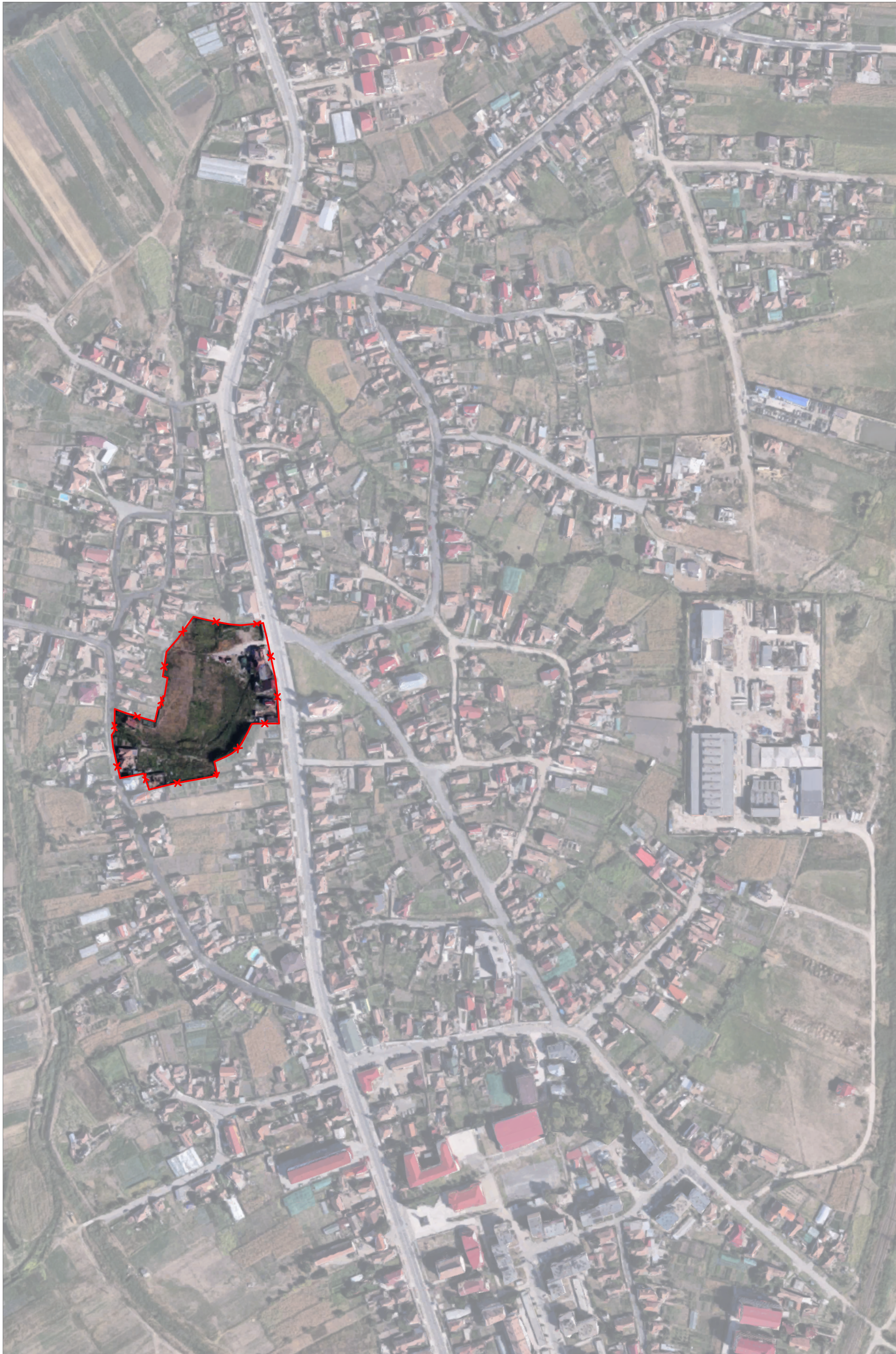
PLAN DE ÎNCADRARE, SATELIT