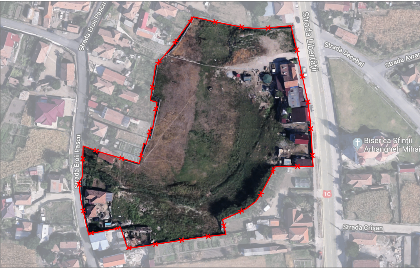
PLAN DE SITUAȚIE EXISTENTĂ, SATELIT L-34-48-D-a-1-III